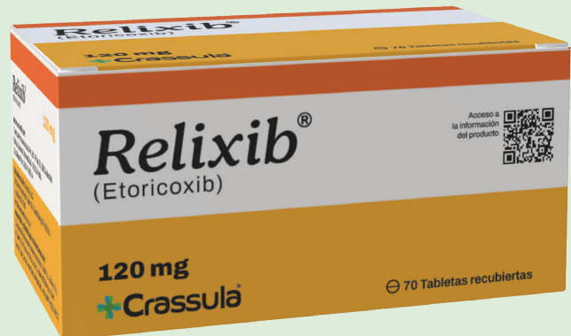
Etoricoxib 120 mg Caja con 70 tabletas Farmacopea Británica