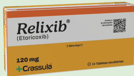
Etoricoxib 120 mg Caja con 7 o 14 tabletas Farmacopea Británica